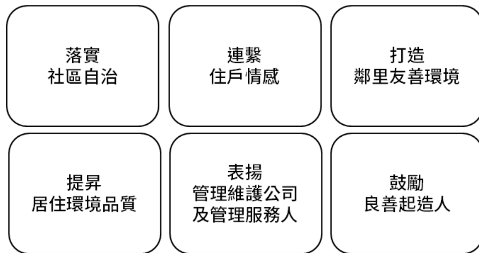
圖、台中樂居金獎核心概念

綜上，本活動透過良性的競爭，提升管理維護、社區綠化、社區營造的品質及友善設施的提供，全面地增加「宜居生活」的深度，重新定義生活品質的質地，塑造社區總體營造目標。