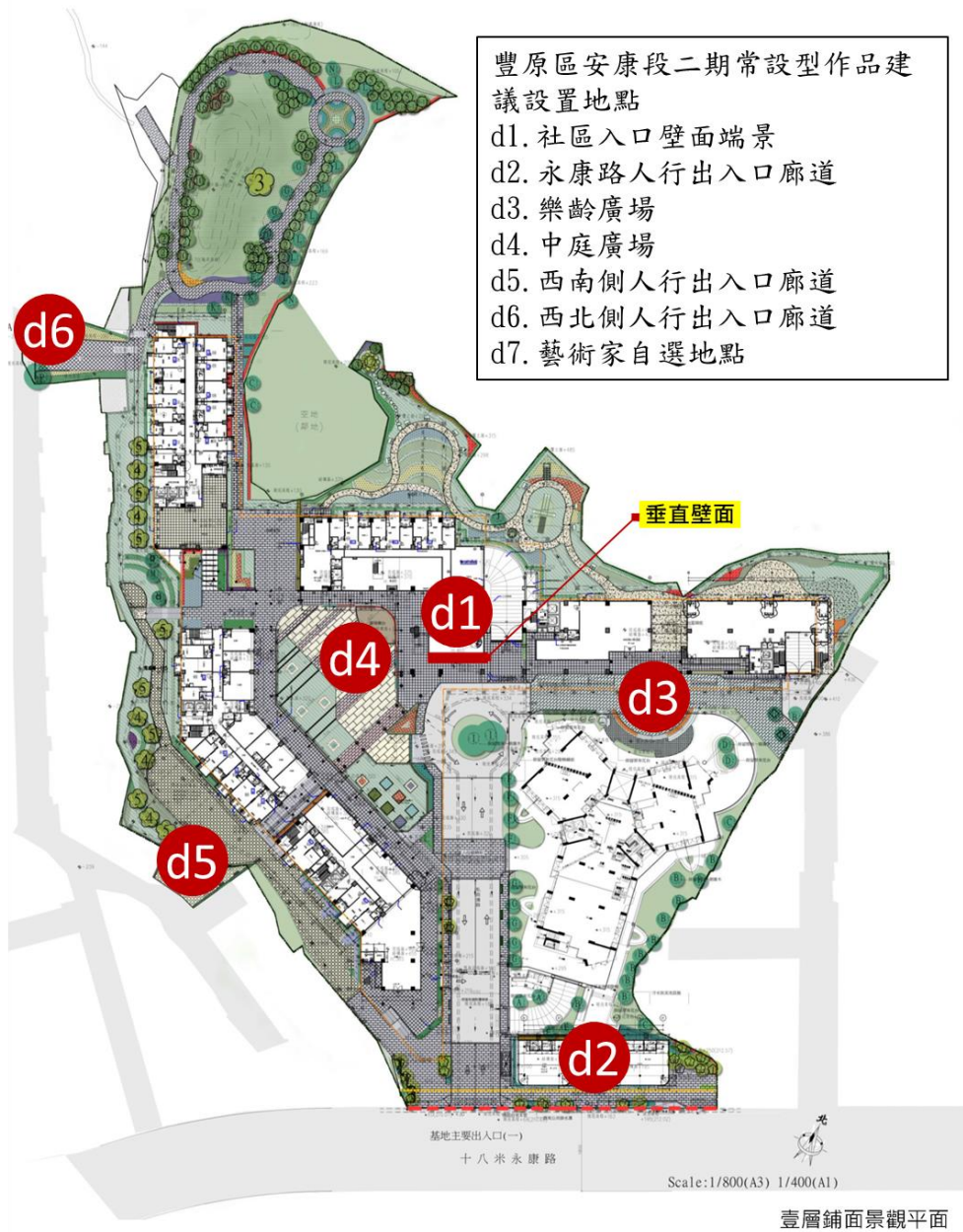
D案豐原區安康段二期常設型作品建議設置地點平面示意圖

備註：創作構想得以一(組)件、多(組)件之方式，分別設置於適當地點，此基地總數設置至少 1 組(件)。